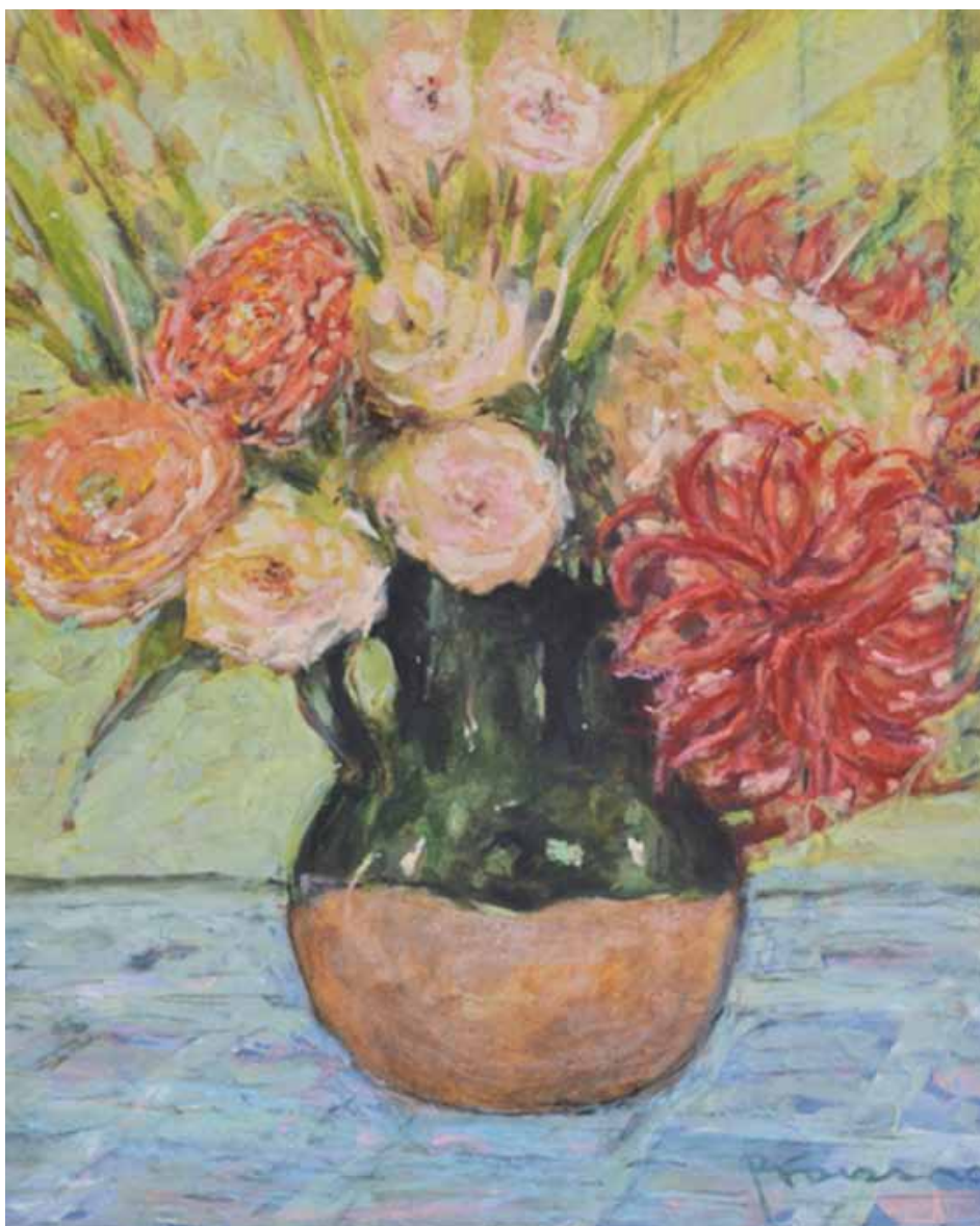
NATURE MORTE Technique mixte sur papier Signée en bas à droite 40 x 32 cm