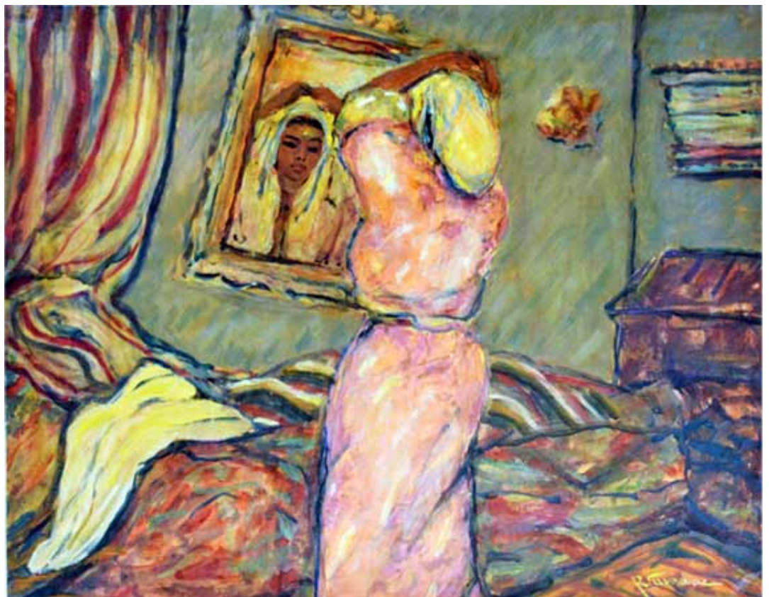
SANS TITRE Huile sur papier Signée en bas à droite 50 x 40 cm