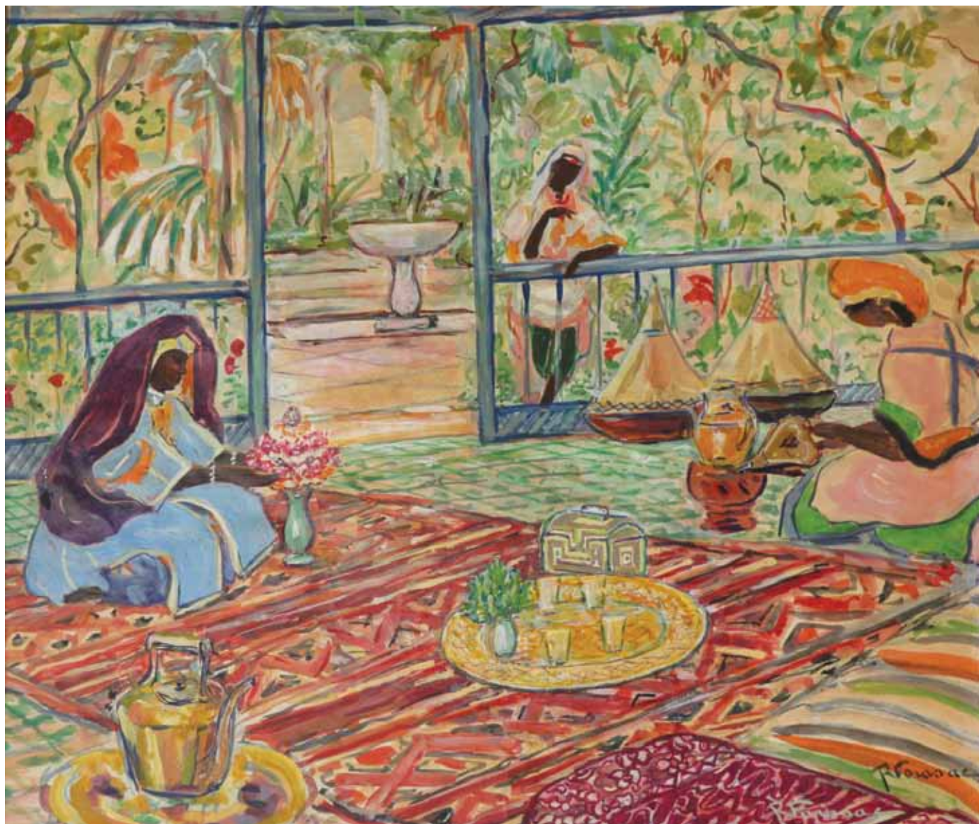
PRÉPARATION DU THÉ Technique mixte sur papier Signée en bas à droite 41 x 48 cm