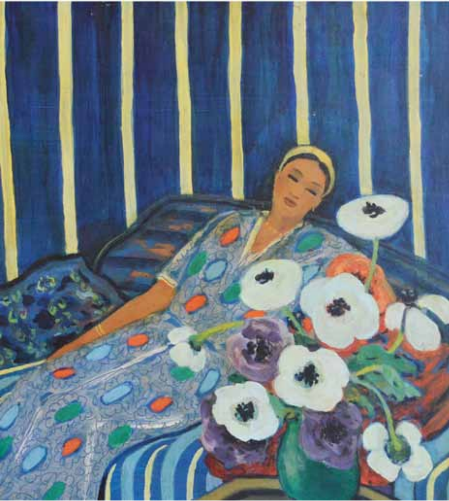
FEMME ASSISE Huile sur panneau Signée en bas à droite 58 x 70 cm