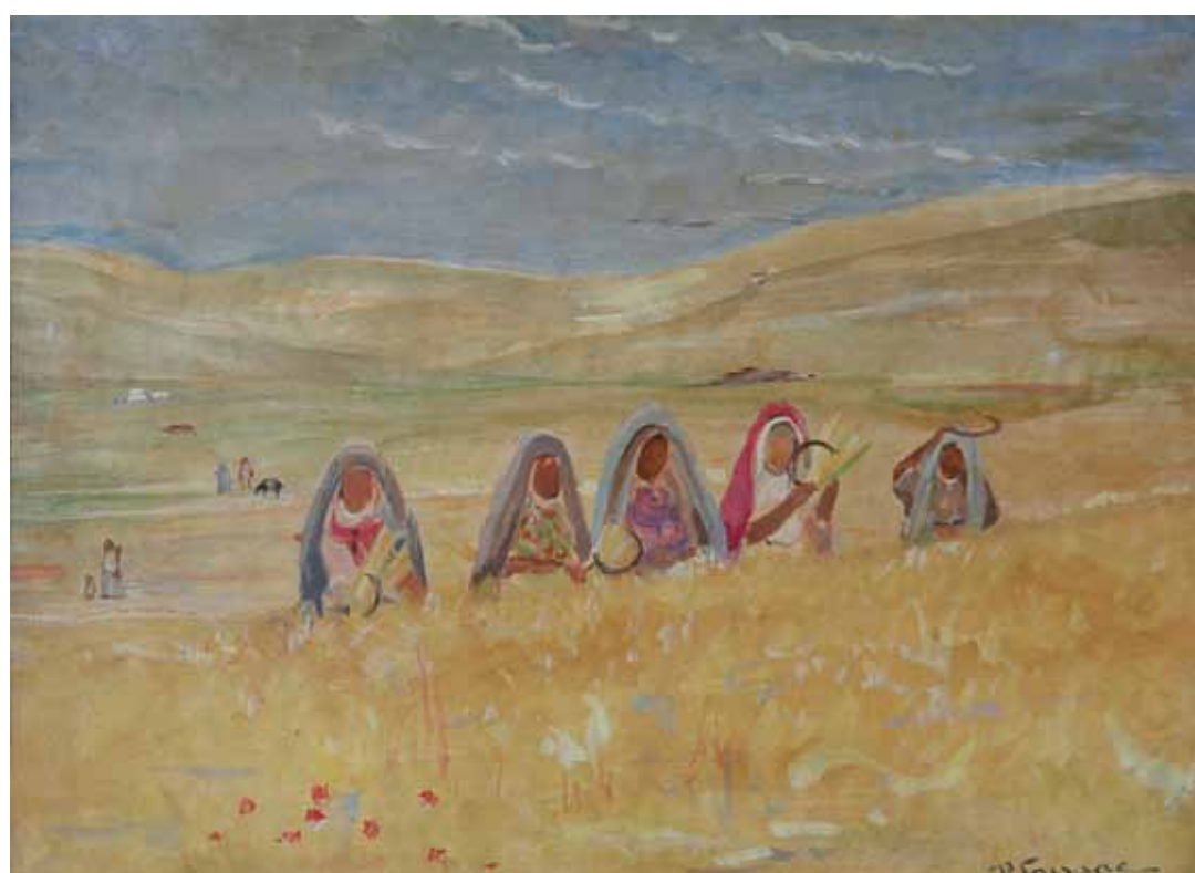
FEMMES AUX CHAMPS Huile sur papier Signée en bas à droite 30 x 42 cm